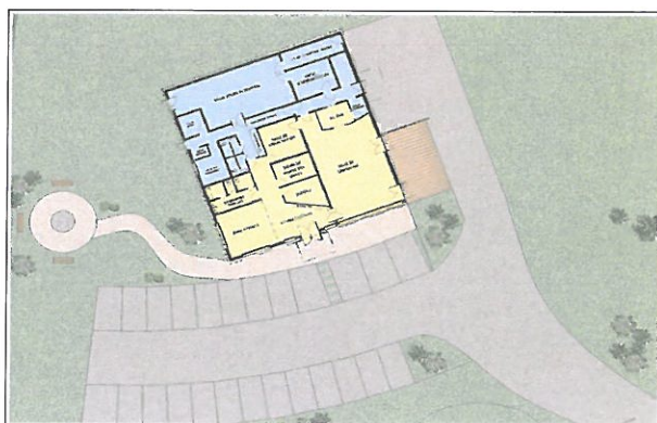
Organisation du site (illustration issue du dossier)

La présentation des différentes installations, bien que facile à appréhender pour le public, reste succincte d'un point de vue technique notamment en ce qui concerne le traitement des fumées. Seul un schéma de principe est fourni dans le dossier. Les préconisations de l'INERIS en matière de traitement des fumées sont citées, sans que les dispositifs effectivement mis en œuvre dans le cadre du présent projet (cyclone, réacteur de mélange, filtres à manche et type de tissu utilisé) soient présentés.